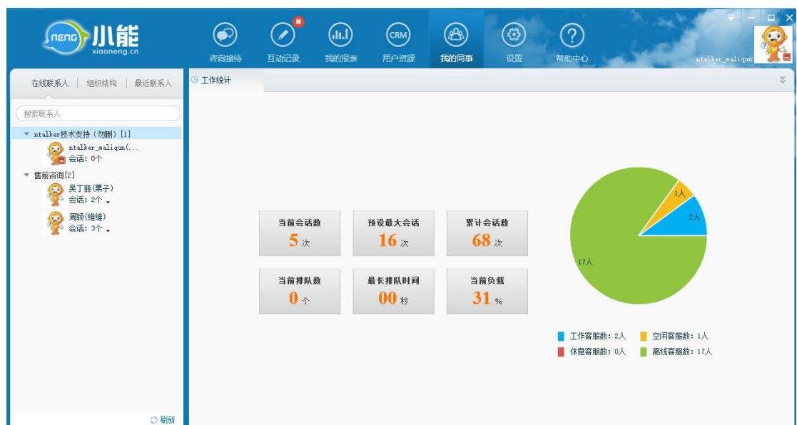
图 1 在线联系人